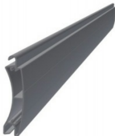
Profile aluminiowe ekstrudowane, typu: PE 41, PE 55