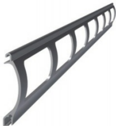
Profile aluminiowe kratowe, typu: PEK 52 z PEKP 52, PEK 77 z PEKP 77, PEK 80 z PEKP 80